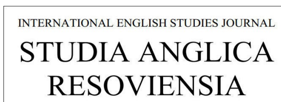
Rys. 3. Strona tytułowa czasopisma „Studia Anglica Resoviensia”

Zawrotu głowy mogą doznać czytelnicy czasopisma „Studia Anglica Resoviensia”. Co prawda taki tytuł jest podany na stronie WWW czasopisma, ale już lektura woluminu 10 z 2013 r. wprawia w zakłopotanie — nie mamy pewności, czy mamy do czynienia z nowym czasopismem, czy też ze zmianą tytułu — lub tylko graficzną modyfikacją jego formy.