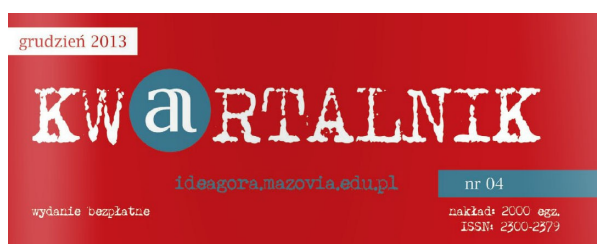
Rys. 1. Okładka czasopisma „Kwartalnik”

Problem z ustaleniem tytułu czasopisma mają nie tylko bibliotekarze. Czasem nawet sam wydawca nie wie, jak właściwie nazywa się wydawany przez niego periodyk. Przykład: w roku 2013 zaczęło się ukazywać czasopismo siedleckiej szkoły Collegium Mazovia Innowacyjna Szkoła Wyższa. Na stronie wydawcy znajduje się informacja (kilkakrotnie powtórzona), że jest to „Kwartalnik ideAGORA”, natomiast z okładki biuletynu dowiadujemy się, że nosi on tytuł... „Kwartalnik”.