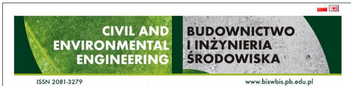
Rys. 7. Winięta czasopisma „Budownictwo i Inżynieria Środowiska” Źródło: Budownictwo i Inżynieria Środowiska [on-line], [dostęp 16.03.2014]. Dostępny w: http://www.biswbis.pb.edu.pl/ .

W wielu wypadkach można dojść do wniosku, że obcojęzyczna wersja tytułu polskiego czasopisma powstała tylko na potrzeby anglojęzycznej wersji strony lub zgłoszenia do Polskiej Bibliografii Naukowej, ponieważ nie pojawia się nigdzie indziej, np. na głównej stronie czasopisma czy w poszczególnych artykułach. Zdarza się, że obcojęzycznego tytułu używają czasopisma publikujące wyłącznie w języku polskim — potencjalny czytelnik otrzymuje więc mylny trop zamiast rzetelnej informacji. Angielski tytuł czasopisma „Dziecko Krzywdzone. Teoria, Badania, Praktyka”, czyli „Abused Child. Theory, Research and Practice” znaleźć można w PBN oraz w angielskim opisie czasopisma. Skoro odbiorcą tekstów jest osoba polskojęzyczna, jedyny używany tytuł czasopisma powinien być również w tym języku.