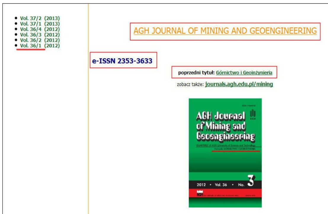
Rys. 5. Strona WWW czasopisma „AGH Journal of Mining and Geoengineering” Źródło: AGH Journal of Mining and Geoengineering [on-line], [dostęp 16.03.2014]. Dostępny w: http://journals.bg.agh.edu.pl/MINING/ .

Na nowej stronie WWW czasopisma zwraca uwagę informacja o poprzednim tytule (widoczna jest ona również na okładce czasopisma) oraz kontynuacja ciągłości wydawanych tomów. Podlinkowany stary tytuł prowadzi do strony z archiwum poprzedniej nazwy. Do kompletu brakuje tylko analogicznych danych na starej stronie tego kwartalnika.