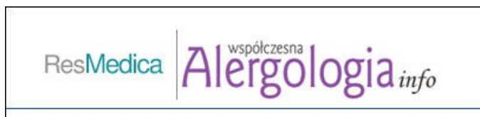
Rys. 2. Winieta czasopisma „Alergologia Współczesna Info”

Nie jest do końca pewne, jaki jest właściwy tytuł czasopisma, którego winieta na stronie WWW wygląda następująco: